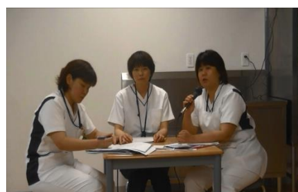
<症例発表 A 病棟：口腔ケア>